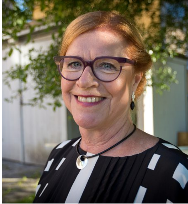
LANDSHÖVDING. Cecilia Schelin Seidegård.